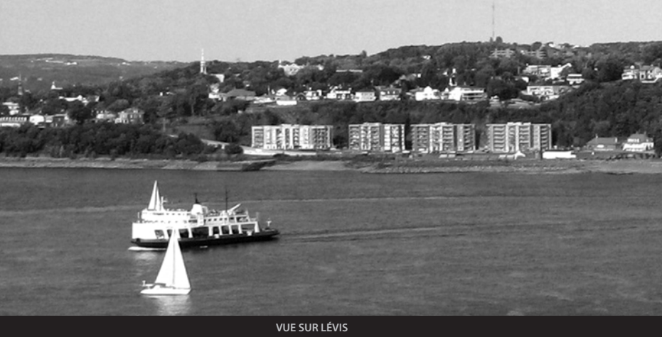
VUE SUR LÉVIS