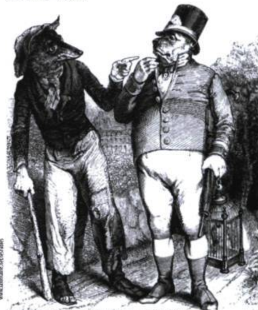
Jean-Jacques Grandville, Le loup et le chien .

Si la fable a disparu de la production contemporaine, sa structure est toujours bien vivante. Celle-ci se retrouve ainsi dans ces petits faits divers cocasses que les agences de presse relaient tout autour de la planète. Comme la fable, ils mettent en scène un renversement spectaculaire de situation, telle cette histoire du voleur qui, s'étant introduit dans un entrepôt et ne retrouvant plus la sortie, finit par appeler la police. On fera prendre conscience des éléments communs et de ceux qui différencient la fable des faits divers de ce genre. On proposera aux élèves de transformer des faits divers en fables en modifiant le titre, en adoptant une disposition « poétique » du texte, en effaçant les circonstances spatiotemporelles et en ajoutant une morale.