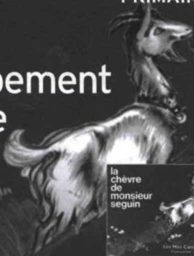
Illustration : Jean-François Martin ( Le Petit Chaperon rouge, Les petits cailloux, 1997 )