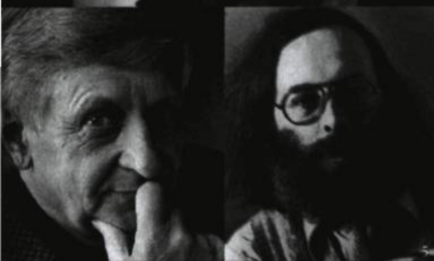
8. PIERRE FALARDEAU