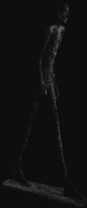
Alberto Giacometti, L'homme qui marche

après, en 1957, Albert Camus présente les choses tout autrement, dans son « Discours de Suède », alors que l'Académie Nobel lui remet son grand prix de littérature : « Le rôle de l'écrivain [...] ne se sépare pas de devoirs difficiles. Par définition, il ne peut se mettre aujourd'hui au service de ceux qui font l'histoire; il est au service de ceux qui la subissent. Ou, sinon, le voici seul et privé de son art. » On le voit, c'est là une position à l'opposé de celle de Gautier, puisque ce dernier refuse à la littérature, et à l'écrivain, toute fonction sociale, et ainsi, tout engagement. Camus est, cependant, de tous les écrivains que l'on dira engagés, celui qui a le mieux fait la preuve que l'engagement présent dans un texte littéraire n'en diminue pas nécessairement les qualités littéraires, et que la rencontre entre le social et le littéraire est non seulement légitime mais, selon lui, nécessaire. Au surplus, les romans de Camus, de L'étranger à La chute , témoignent