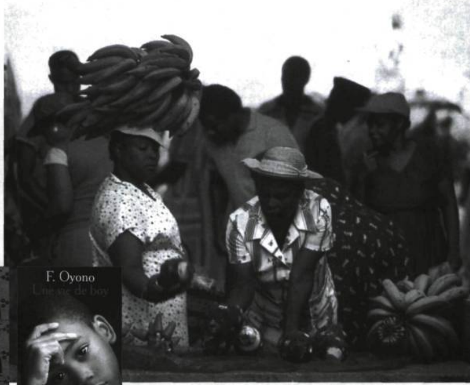
Marché en République Dominicaine, © Photo Bruce Dale (Source : National Geographic, vol. 177 n° 6, page 115).