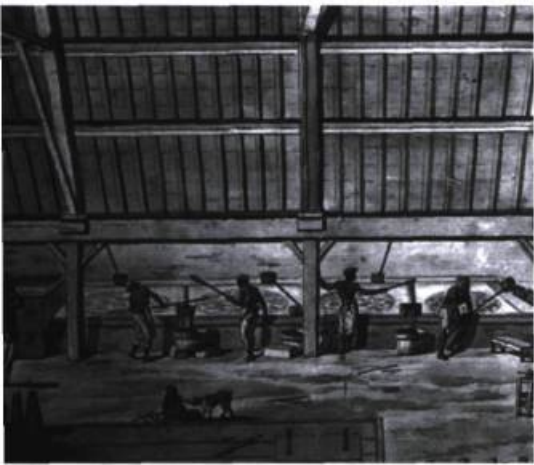
L'organisation du travail des esclaves dans les sucreries.

parce que pratiquant, entre autres, l'alternance de modes narratifs et le mélange des genres que l'auteur défend énergiquement dans la préface. Ousmane Sembene, écrivain devenu cinéaste depuis quelque temps, adopte dans ses romans certaines techniques de son nouveau métier. Ainsi peut-on déceler, par exemple, dans les romans qu'il fait paraître dès cette époque, des descriptions dont la minutie et le kaléidoscope tiennent du mouvement de la caméra 9 . Alors qu'Ahmadou Kourouma, avec Le soleil des indépendances (Paris, Seuil, 1968), semble s'appliquer à acclimater ou, si l'on ose dire, à « africaniser » la syntaxe et le vocabulaire français, Yambo Ouologuem, dans Le devoir de violence (Paris, Seuil, 1968), cherche à faire « violence » à la conception traditionnelle du roman, tant du point de vue thématique que de celui de la forme et du style.