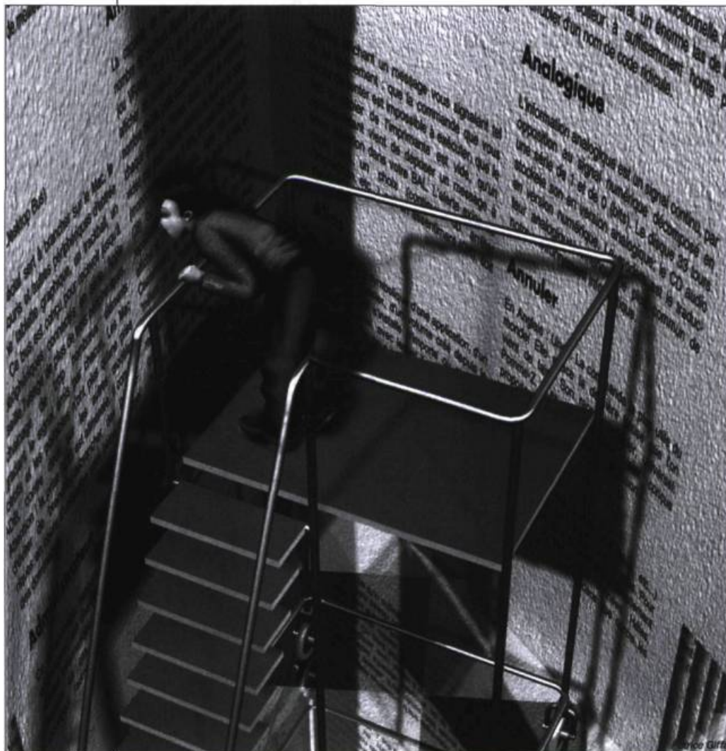
Illustration : Patrice Giffard, revue Golden , juin 1996.