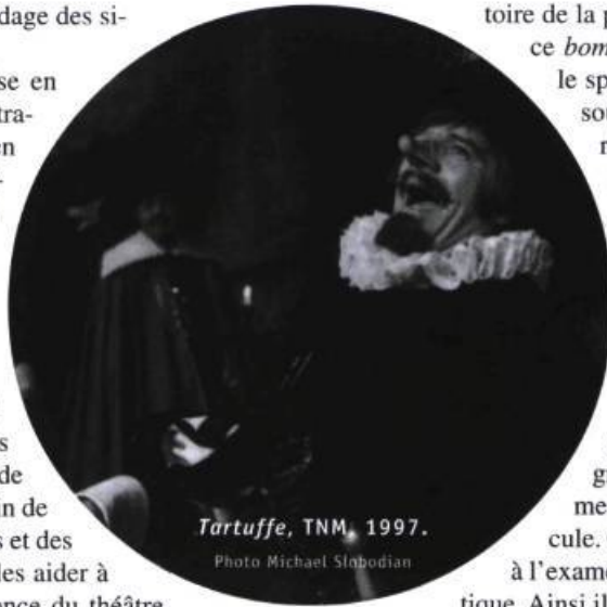
Tartuffe, TNM, 1997.

Dans le cas où un professeur amènerait ses élèves voir un spectacle monté à partir d'un texte disponible, il est certes recommandé de faire la lecture de ce texte avant d'aller au spectacle, même si des élèves se plaignent qu'on les prive ainsi du plaisir relié au suspense . Ils y gagneront car ils seront plus attentifs aux moyens spécifiques du théâtre de leur présenter l'his-