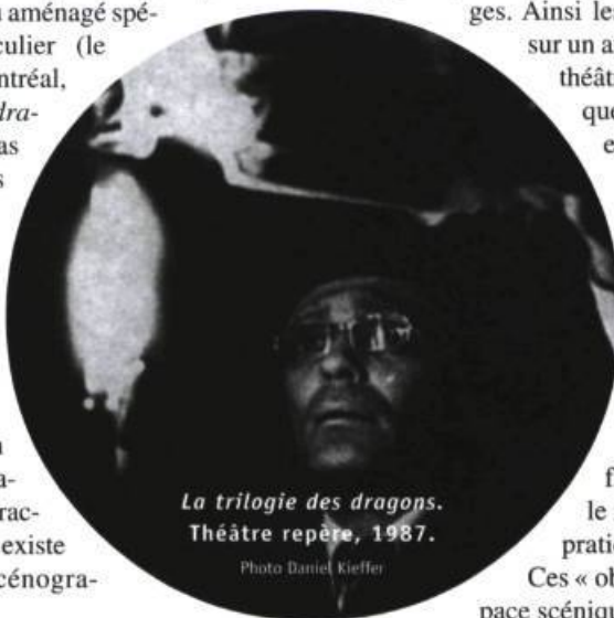
La trilogie des dragons. Théâtre repète, 1987.

Déjà, en parlant de décor, nous attirons l'attention sur un ensemble d'autres signes théâtraux car, s'il peut être fabriqué d'éléments fixes comme une véritable construction ou une toile peinte, il peut aussi se modifier en cours de spectacle par l'ajout ou le retrait d'éléments mobiles comme des praticables, des accessoires, des meubles. Ces « objets » viennent habiter et modifier l'espace scénique comme le font par ailleurs les éclairages :