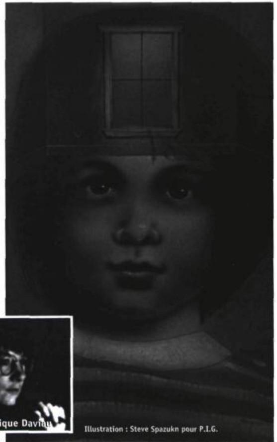
Illustration : Steve Spazukn pour P.I.G.

La poésie du premier recueil réside surtout dans le regard direct et émerveillé des nombreux enfants qui peuplent l'univers de Daviau (des garçonnetts jouant au ballon, des fillettes s'amusant avec leurs poupées, des gamins envahissants réclamant attention et amour) ou dans celui de tous ces hommes et femmes désireux de rester des enfants et de garder leurs illusions pour revivre l'émerveillement de l'enfance. Mais, derrière chaque récit, se profile une dure leçon de vie : l'arbre dénonce l'abdication des hommes face à celui qui sait les enchanter par de vaines paroles ; l'enfant de la ville, superficiel et vaniteux, découvre la nature et le bonheur pour les perdre plus tard et sentir encore plus cruellement l'amertume de la solitude ; tel protagoniste déplore la perte d'une mémoire identitaire ou le manque