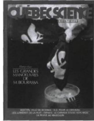
Quelques couvertures de Québec Science rappelant les débuts de ce magazine en commençant par son premier numéro publié en janvier 1970.

sionnelle. Les techniques journalistiques s'affirment : création de chroniques, nouvelles brèves, importance de la photo, avec sa légende, titres, intertitres, etc.