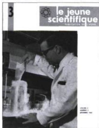
La revue Le Jeune Scientifique , l'ancêtre du magazine Québec Science . Cette revue s'adressera jusqu'en 1969 aux écoliers du secondaire.

Si Québec Science vise toujours à promouvoir des carrières scientifiques, les moyens ont changé. Les journalistes ont pris le pouvoir et commencent à transformer Québec Science en un véritable magazine.