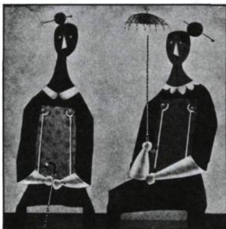
Punaises de sacristie , 1957. Huile sur contreplaqué, 61 cm x 61 cm.

Dallaire ou l'œil panique se présente dans un très grand format et compte tout près de 300 illustrations dont une trentaine en couleurs. Tableaux, dessins, photographies, esquisses, tous ces éléments concourent à dresser un inventaire assez complet et significatif de la vie et de l'œuvre de Dallaire. Cinq parties d'inégales longueurs composent le livre: «Œil panique», autrement dit l'introduction, pose et délimite les termes mêmes du sujet, la seconde partie — la plus volumineuse — «Chroniques» retrace la biographie de ce peintre né à Hull le 9 juin 1916 et décédé à Vence, dans les Alpes-Maritimes, en 1965. Aîné d'une famille nombreuse, Dallaire quitte l'école très tôt et se fait remarquer par son coup de crayon particulièrement habile pour cet âge. Après un séjour chez les dominicains d'Ottawa, qui l'avaient invité, et encouragé dans son art par le père Georges-Henri Lévesque, le jeune artiste obtient une bourse d'étude du Gouvernement du Québec. Nouvellement marié, il quitte Montréal en 1938 et s'installe à Paris où il fera la connaissance d'Alfred Pellon qui aura une influence marquante dans son traitement chromatique. Il suit quelques cours et visite de nombreux musées avant d'être emprisonné en 1940 au Stalag de Saint-Denis par les Allemands. Il s'instruit en autodidacte et n'est relâché qu'en 1944, à la fin des hostilités. De retour au pays, il est professeur à l'école des Beaux-Arts de Québec de 1946 à 1952 puis il travaille à