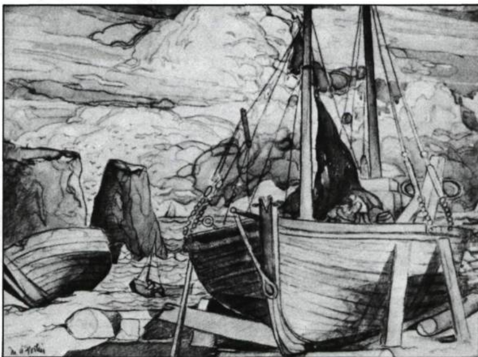
Barques de pêche, Percé, aquarelle, 22 x 29cm. Coll. Hôtel Reine-Élisabeth, Montréal.