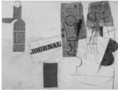
Planche 4. Picasso, Bouteille, verre et violon , 1912. Moderna Museet, Stockholm, Suède. © Succession Picasso Paris/SODRAC (Montréal) 2005.