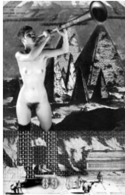
Planche 3. Peter Greenaway, La Destinée (1995).

Nul doute que la ruine ait pu, puisse encore présenter la valeur symbolique de la dissolution et la décadence induites par le passage inéluctable du temps – citons le «landart» de Robert Smithson dont Owens parle souvent, ces installations-sculptures qui finissent toujours par être récupérées par l'environnement naturel dans lequel elles ont été exécutées, dans les eaux du lac à Salt Lake City, par exemple –, ni que la tête de mort ait pu servir, surtout dans les églises, de rappel de leur mortalité aux chrétiens peu enclins à suivre le droit chemin. Il