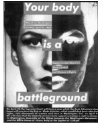
Planche 5. Barbara Krüger, Untitled , 1989. © Barbara Krüger/SODRAC (Montréal) 2005.

Avant la fin du siècle dernier, et ce, précisément à l’époque où Owens composait son article sur l’allégorie, cette tension était en voie de résolution au profit de l’écriture, comme le montre cette image de