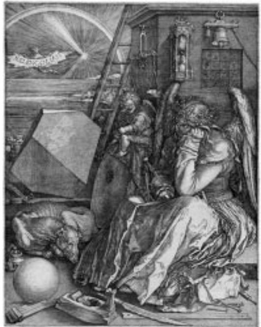
Planche 1. Albrecht Dürer, Melencolia 1 , 1514.