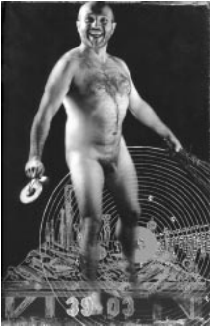
Planche 2. Peter Greenaway, Marsyas (1995).

de mort. Et aussi vrai qu'il n'y a en celle-ci nulle liberté «symbolique» de l'expression, nulle harmonie classique de la forme, nulle humanité, l'énigme qui s'exprime dans cette figure, la plus soumise à l'empire de la nature, ce n'est pas simplement la nature de l'existence humaine, mais l'historicité de la biographie individuelle. C'est là le noyau de la vision allégorique, de l'exposition baroque de l'histoire comme histoire des souffrances du monde; elle n'a de signification que dans les stations de sa décadence. (Benjamin, 1985: 178-179)