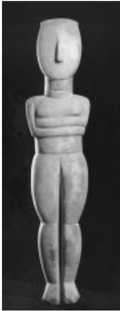
Planche 8. Figurine cycladique de femme, env. 2800-2300 av. J.-C.