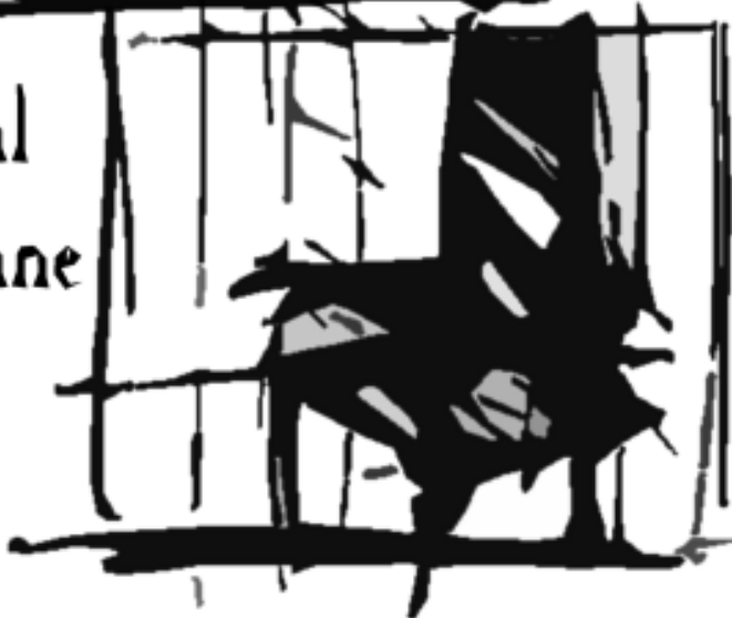
Le fauteuil dans la vitrine

Illustrations de Carol Dallaire à partir des croquis du story board de Robert Wilson.