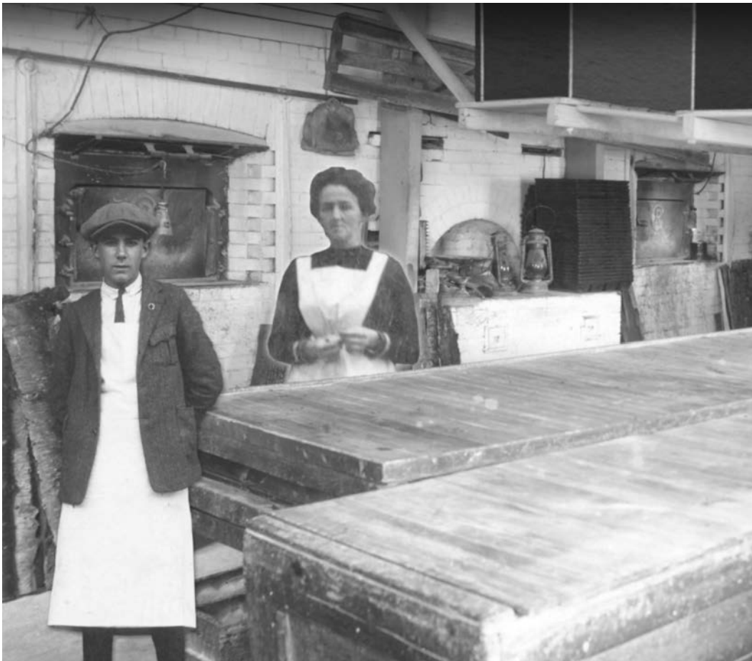
Figure 2. Capture d'écran issue du webdocumentaire De la ferme à l'assiette (labdoc / laboratoire d'histoire et de patrimoine de Montréal, 2024).

Prenons un exemple, soit l'intégration, dans le webdocumentaire, d'une séquence de type « archives » qui porte sur une photographie prise dans une boulangerie au début du xx e siècle. L'image telle qu'elle est montée dans le webdocumentaire, avec la présence de personnages ajoutés par collage [Figure 2] donne accès par un clic à une numérisation de la photographie originale [Figure 3] 22 . Une voix off explique :