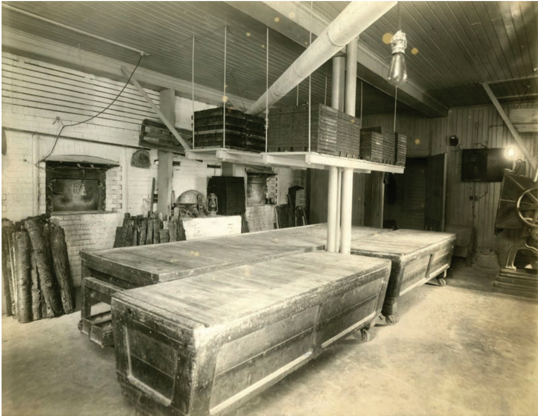
Figure 3. Photographie originale issue des collections de BANQ intégrée dans la séquence de type « archives ».

Cette photographie prise vers 1910 donne à voir l'intérieur de la boulangerie Monette à Pointe-aux-Trembles. Cette image est assez exceptionnelle. En effet, les images d'intérieur de boulangerie québécoise datant du début du xx e siècle sont rares. C'est la raison pour laquelle nous avons considéré que cette image était particulièrement intéressante pour servir de décor à l'action du webdocumentaire. Il est aussi à noter qu'à droite de la photographie, on voit un pétrin mécanique, ce qui constitue l'une des premières innovations technologiques dans la fabrication du pain. Pour le webdocumentaire, nous l'avons légèrement recadrée pour que l'on voie bien les fours à pain et nous avons caché les moules qui se situaient en haut à droite de l'image.