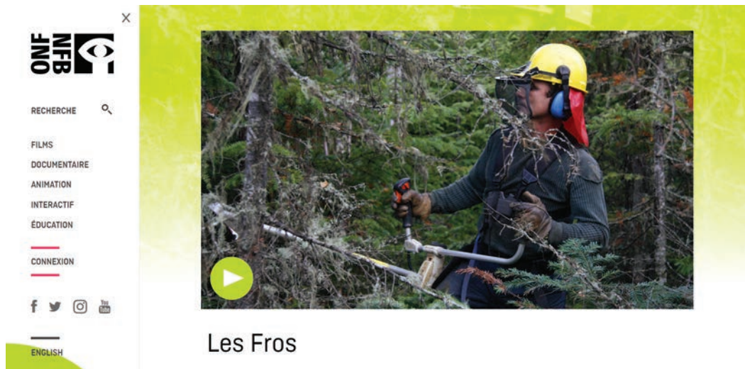
Figure 1. Capture d'écran du film documentaire Les Fros (Stéphanie Lanthier, 2010) tiré du site internet de l'Office national du film du Canada (ONF).

respectives, plus de traces, par contre, des paratextes qui ont accompagné leur sortie 12 . C'est également le cas pour les « classiques » de la filmographie documentaire québécoise. La page consacrée à la plongée dans l'industrie textile montréalaise des années 1970 du réalisateur Denys Arcand, On est au coton (1970), ne présente qu'un court synopsis et quelques questions générales présentées dans une section intitulée Éducation .