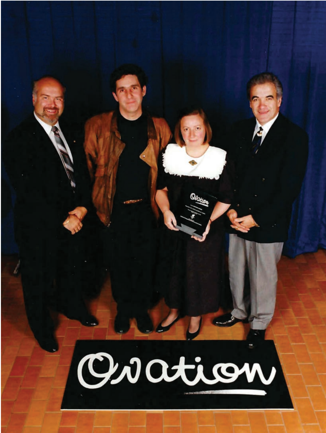
Figure 2. Photo prise lors de la remise du prix Ovation au projet Cinémagie par le Regroupement Loisir Québec, la Société de développement du loisir et du sport du Québec et la ministère du Loisir, de la Chasse et de la Pêche du Québec en 1992.