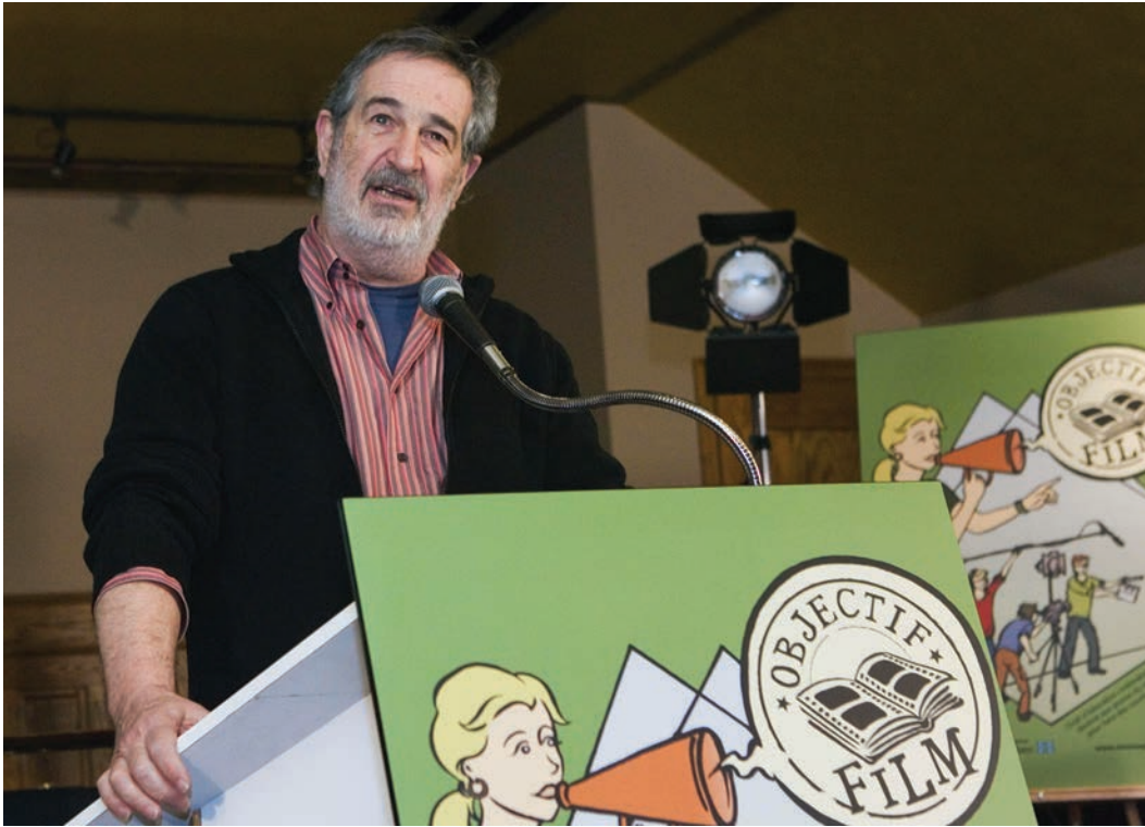
Figure 3. Photo d'André Melançon prise lors du lancement officiel du guide Objectif film au Théâtre Outremont, le 19 mars 2007.

D'un professionnalisme indiscutable, celui-ci a pris soin de bien analyser le document et de rencontrer l'équipe de L'OEIL CINÉMA avant d'accepter d'y associer son nom. Il constate le chemin parcouru par l'ACPQ depuis le début des années 1980 et la diversité des activités maintenant offertes aux jeunes, un public qu'il chérit depuis toujours. Sa gracieuse collaboration a largement contribué à la visibilité d' Objectif film , qui est un véritable succès. Les enseignants inscrits à L'OEIL CINÉMA peuvent obtenir sans frais une copie du guide, dont le prix de détail suggéré est de 24,95 $ pour chacun de leurs élèves. Le preneur de son Hubert Macé de Gastines se joint à l'équipe de l'ACPQ en septembre 2007 comme directeur des services éducatifs. Les contacts et les partenariats avec de nombreuses institutions s'intensifient alors au Québec comme à l'étranger. Des liens se tissent avec Festimaj, un festival de films d'écoles à Meyzieu, près de Lyon, en France, qui met le Québec à l'honneur en 2008 et qui confie la présidence de son jury à André Melançon. Des festivaliers d'une trentaine de pays ainsi que les vainqueurs des différents prix