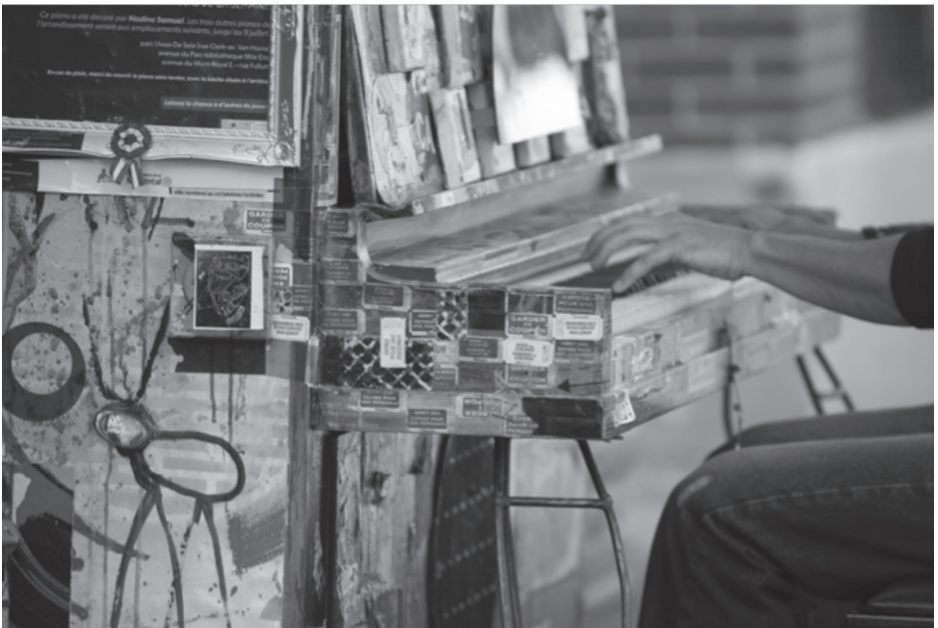
Piano urbain.

Le système tonal, en fonction duquel la musique s'organise autour d'accords et de gammes majeurs et mineurs, a constitué le plus important moyen d'organisation de la musique occidentale de 1600 à 1900. Dans la foulée de la quête de liberté créatrice qui anime les peintres du début du XX e siècle, Schönberg et les compositeurs de la seconde école de Vienne vont développer, dans les années 1910, une musique atonale, c'est-à-dire échappant aux règles traditionnelles d'organisation et de résolution des accords. Du coup, chaque note peut être suivie de n'importe quelle autre, au gré du compositeur. Cette liberté totale, déjà anticipée par Franz Liszt dans sa Bagatelle sans tonalité (1885), sera pleinement assumée par Schönberg avec Pierrot lunaire (1912).