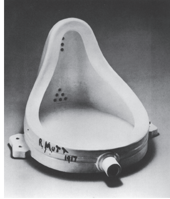
Marcel Duchamp, Fontaine , ready-made, 1917

intitulé Fontaine . Ces deux œuvres marquent le vingtième siècle comme les attentats du World Trade Center et l'entrée de la Chine dans l'Organisation mondiale du commerce (OMC) marqueront le vingt et unième (peut-être aussi trop tôt pour en tirer cette conclusion). La première œuvre citée est tout simplement vertigineuse. Nous fait carrément perdre pied. Nous fait sentir, pour utiliser une image du cinéma américain, comme Jim Carey qui touche la finitude de sa vie préfabriquée ; la toile-vie de Truman show 8 . La nausée liée à la perte de l'innocence. La réalisation de la supercherie. Comment aller plus loin dans l'histoire de la couleur et de l'art que de peindre du blanc sur du blanc ? Comment aller plus loin dans notre histoire sociale et politique que de se battre contre nous-mêmes (fin de la Première Guerre mondiale) ?