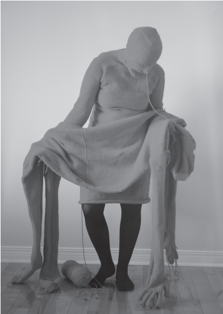
Bozica Radjenovic, Pieta 1 , Épreuve numérique sur papier, 2014.

situé et, par extension, un soin pratique de nos capacités d'initiative. Manière donc de réduire l'échelle afin d'éviter les généralités, et de répondre d'aussi près que possible à la question avec laquelle tu termines ton texte : « Quel est ton espace de création ? »