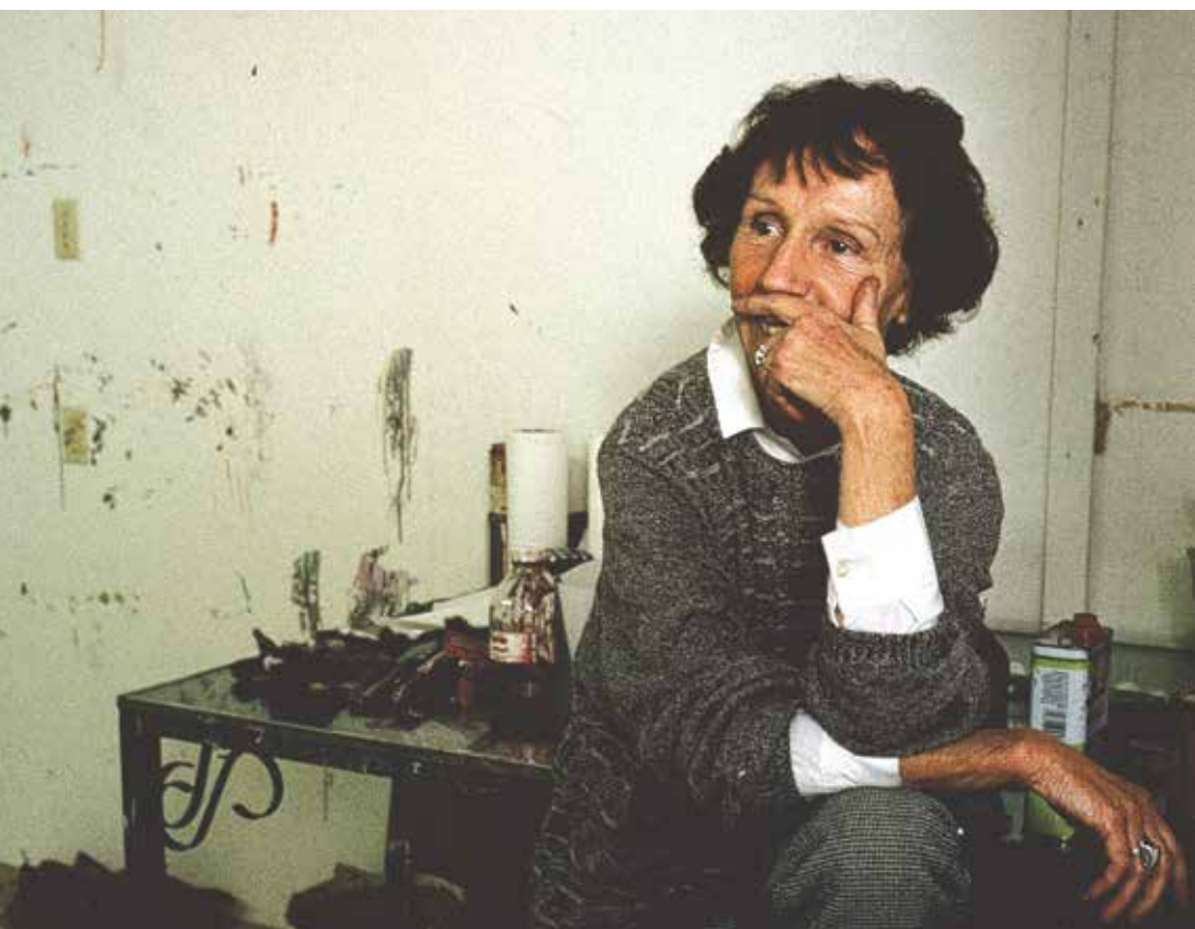
Marcelle Ferron dans son atelier d'Outremont