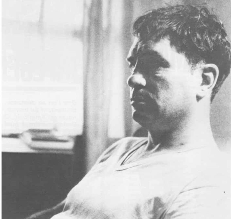
Jack Kérouac à Hyannis, Massachusetts, 1966.

Salinger, The Catcher in the Rye , dans lequel la voix du jeune Holden Caulfield nous restait en mémoire longtemps après avoir refermé le livre. Là est la force de ces œuvres qui s'imposent en se frayant un chemin jusqu'à nous sans solliciter notre adhésion première et inconditionnelle. Kérouac ne cherchait pas uniquement à reproduire la langue parlée de son enfance (faut-il ici rappeler qu'il n'a parlé que le français jusqu'à l'âge de six ans), le franco-américain, qu'il ne considère et ne traite nullement comme un appauvrissement du français parlé au Québec ou en France, mais il se voulait aussi le témoin, voire le chantre du désespoir vécu par ces milliers d'expatriés qui n'ont jamais oublié leur foyer d'origine et qui ont souvent vécu dans des