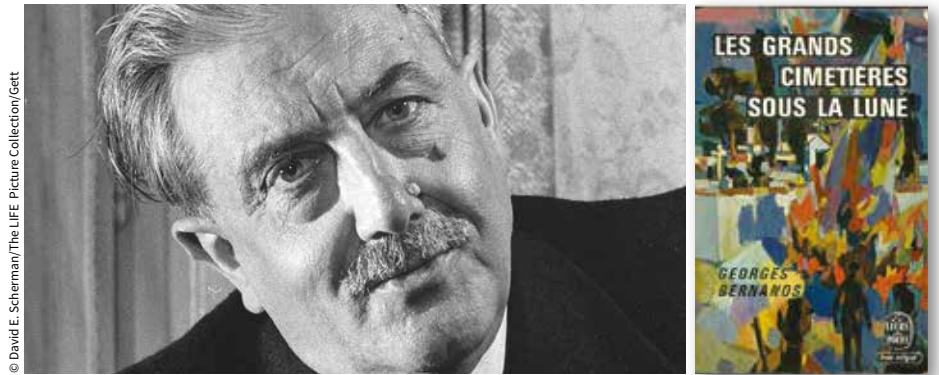
Georges Bernanos en 1946

fournit la liste) cautionnant les tueries et bénissant les canons de Franco et de ses sbires. Bernanos horrifié dénonce les atrocités commises au nom de la croisade antibolchevique. Pour le lecteur d'aujourd'hui qui n'a pas une connaissance précise de la France politique d'avant-guerre, le livre est parfois peu intelligible, bien des références et allusions lui échappent, noyées dans un discours diffus et répétitif. Inlassablement