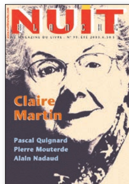
N° 91, été 2003

L'Antiquité est une véritable passion pour l'auteure de la Colombie-Britannique Annabel Lyon qui, après Le juste milieu , nous revient avec Une jeune fille sage (Alto), un roman sur la fille d'Alexandre le Grand. Contrairement aux filles de son âge, Pythias préfère suivre les enseignements de son précepteur, Aristote. À la mort de son père, elle devra inventer son propre destin.