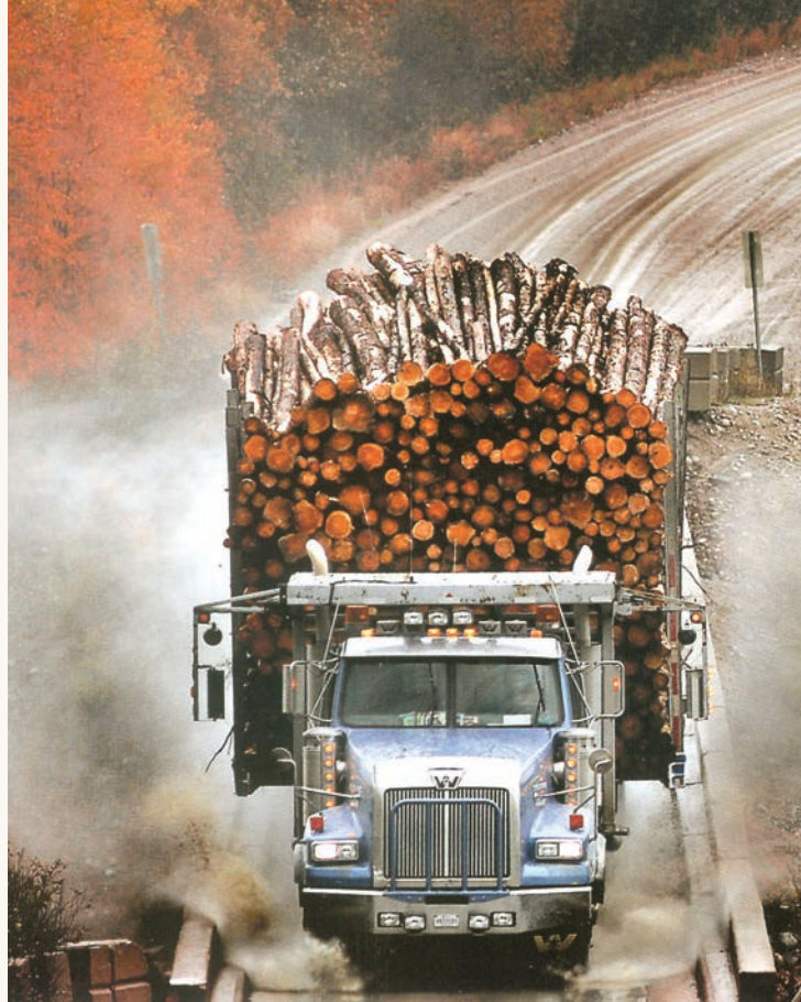
« Le courage du camion », p. 150