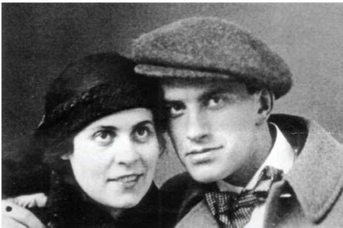
Lili Brik et Vladimir Maïakovski