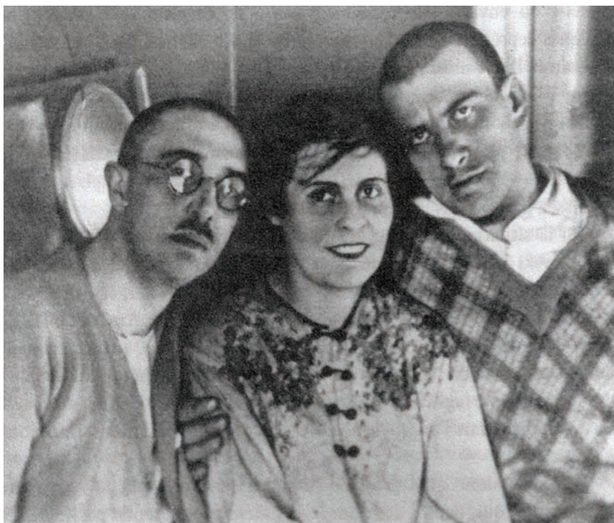
Une des rares photos réunissant Lili, Ossip et Maïakovski prise en 1929