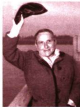
Gertrude Stein en 1935

Dans Pacific Agony, Chroniques de voyage imaginaires sur les rives du Pacifique nord (Rivages ; traduit par Josée Kamoun), Bruce Benderson troque son underground new-yorkais familial pour l'Ouest américain. Ce « faux » voyage lui permet, du même coup, de faire la critique d'une certaine société écologique bien-pensante.