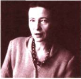
Simone de Beauvoir vers 1950