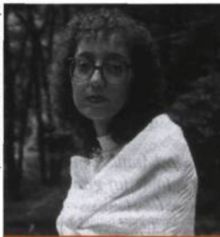
Joyce Carol Oates