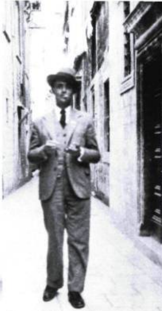
Joseph Vicenç Foix