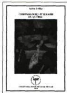
Chronologie littéraire du Québec Sylvie Tellier. 350 pages 18,50 $