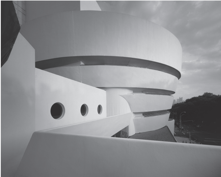
The Solomon R. Guggenheim Museum, New York.