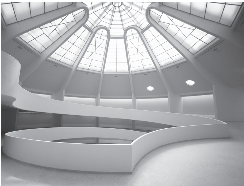
Vue sur la rotonde du musée. The Solomon R. Guggenheim Museum, New York.