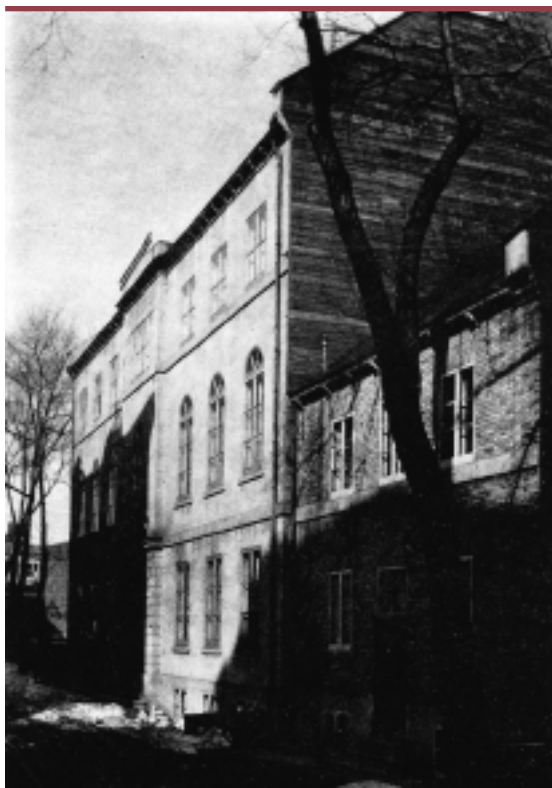
Figure 3. Ancien pavillon de médecine.