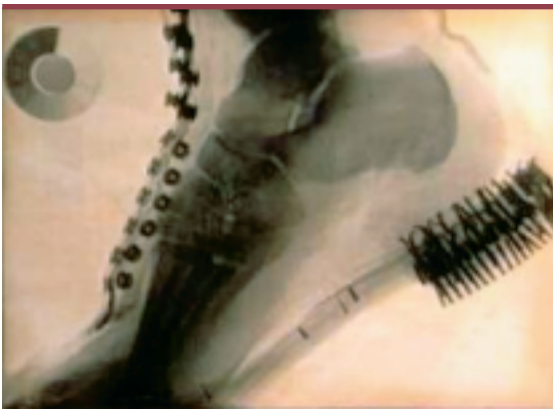
Figure 1. Radiographie d'un pied recouvert de sa chaussure prise à l'aide du « skiascope », appareil à rayons X inventé en 1896 par Mgr Clovis Laflamme, professeur de physique et Recteur de l'Université Laval.

Il y décrit notamment les cellules sympathicotropes dites « cellules de Berger » ( Figure 2 ). Un Institut de biologie et un Institut du cancer furent également créés. Un Service de diététique vit le jour et les écoles d'infirmières de plusieurs hôpitaux furent affiliées à la Faculté. En 1929, l' American Medical Association