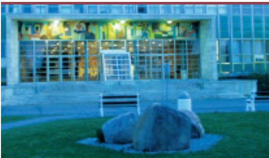
Figure 5. Le pavillon Ferdinand-Vandry de la Faculté de médecine érigé sur le nouveau campus en 1957.

One hundred and fifty years of medicine in Quebec city at the Université Laval