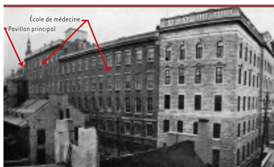
Figure 4. Le pavillon de 1923 dans le Vieux-Québec.