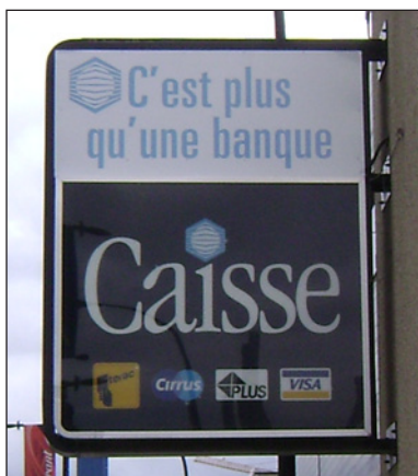
Photo 9 Enseigne faisant face à l'est