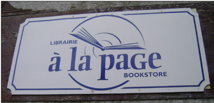
Photo 4 Enseigne de la librairie À la page