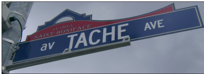
Photo 6 Panneau de l'avenue Taché

L'enseigne d'une clinique dentaire (photo 7) et le message que celle-ci affiche dans sa vitrine illustrent que le propriétaire ne croit pas que le français ait une valeur d'usage direct. Ainsi, il utilise la langue qui va transmettre le message. La clientèle visée est donc une clientèle anglophone ou qui parle assez bien l'anglais.