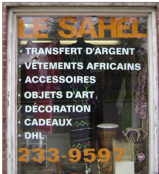
Photo 1 Le seul affichage commercial unilingue français