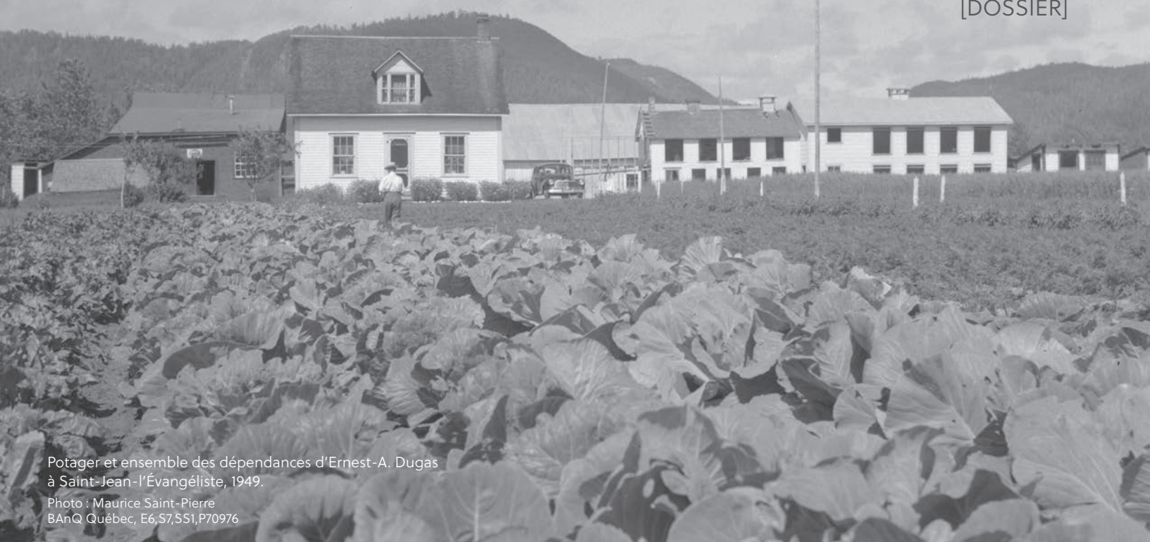
Potager et ensemble des dépendances d'Ernest-A. Dugas à Saint-Jean-l'Évangéliste, 1949.

Photo : Maurice Saint-Pierre BAnQ Québec, E6,S7,SS1,P70976