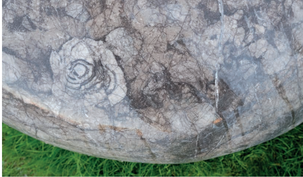
Détail de Tlapataqanji' .