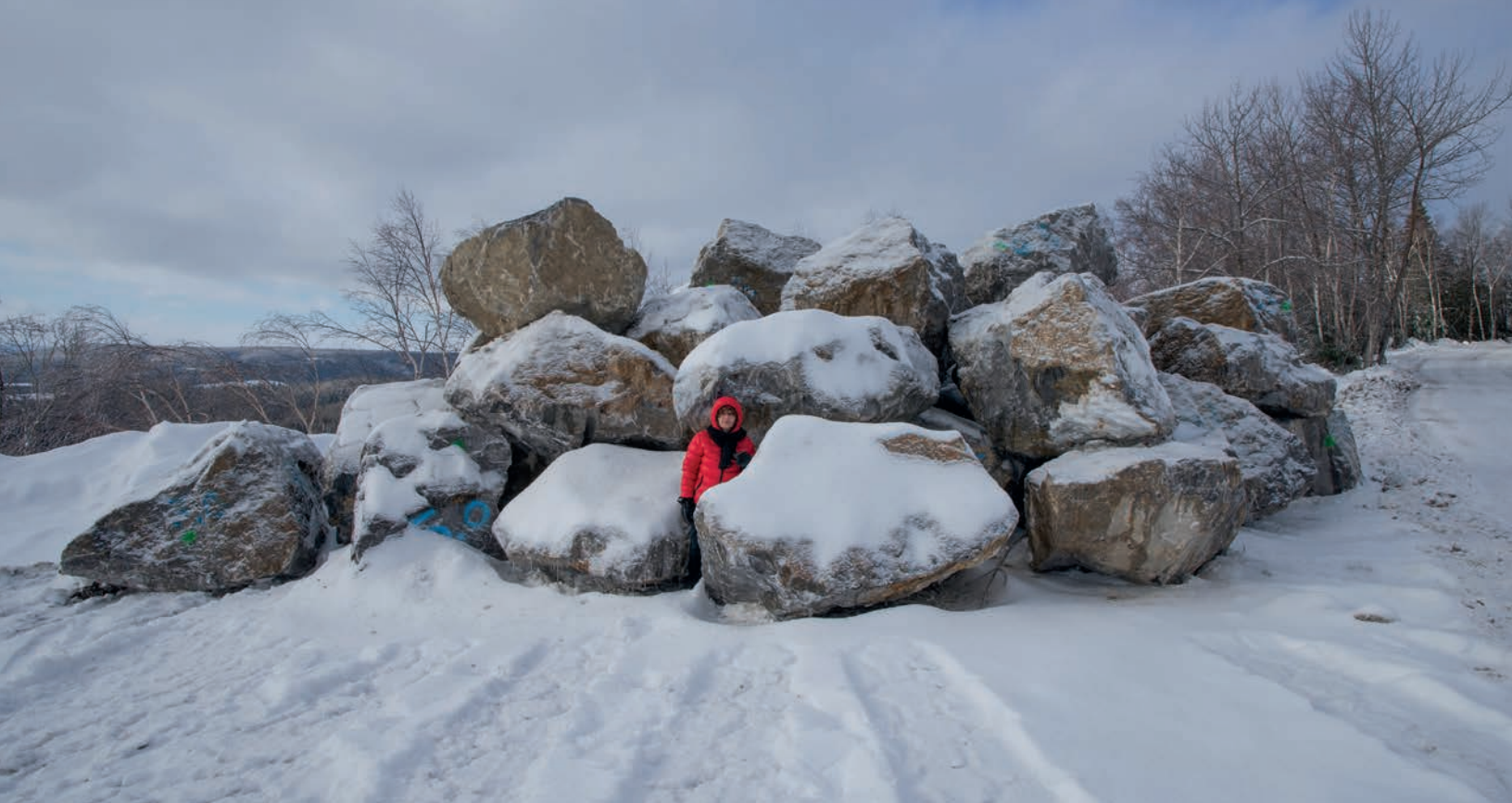
Pierres dans la carrière de Nouvelle.