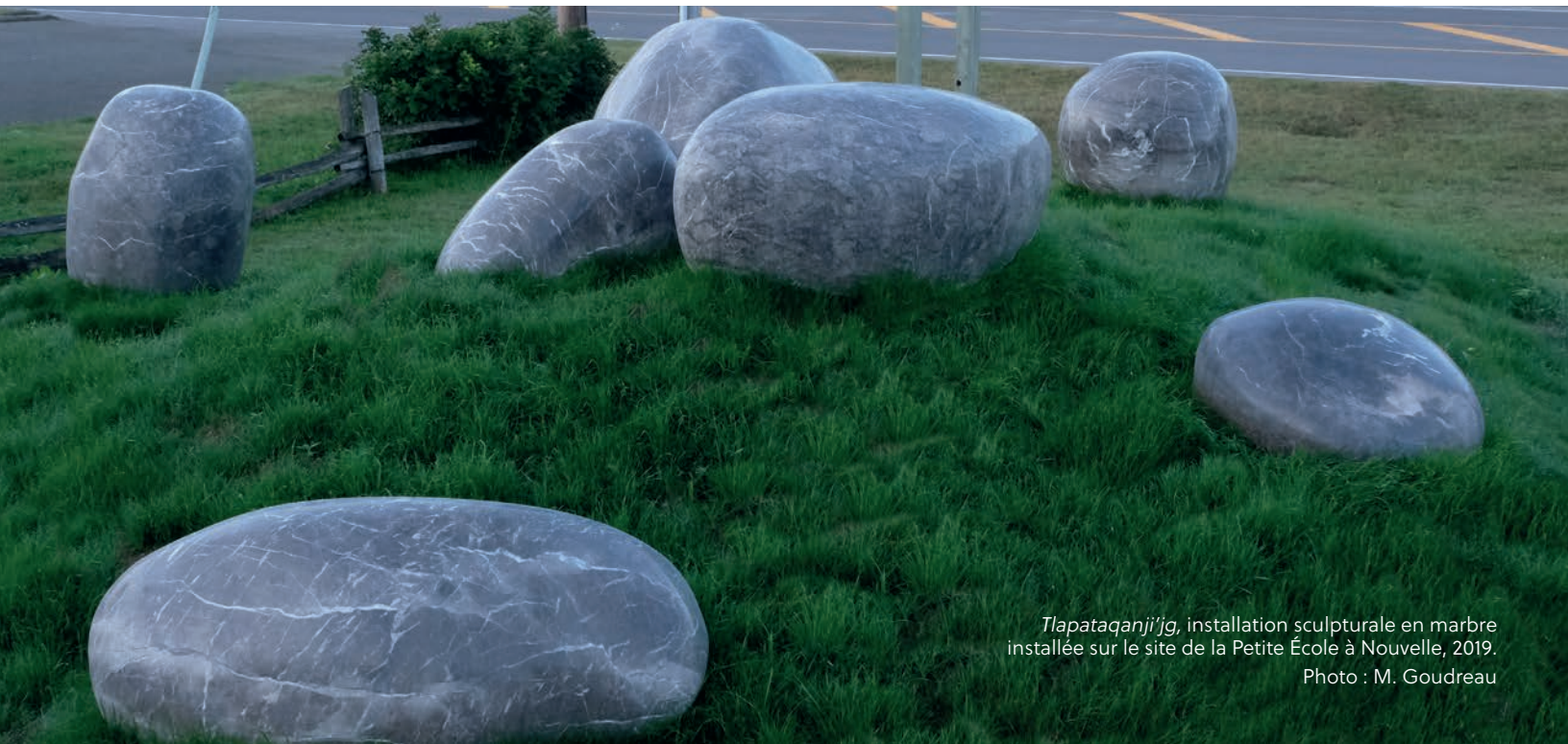
Tlapataqanji' , installation sculpturale en marbre installée sur le site de la Petite École à Nouvelle, 2019.