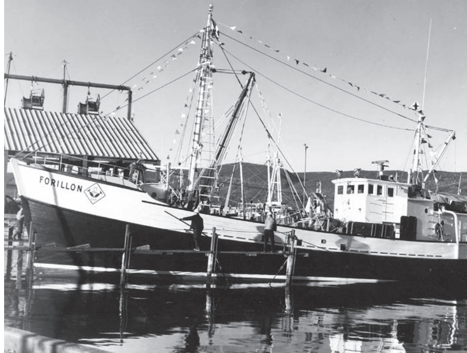
Lancement du Forillon , un chalutier en bois de 87 pieds, au chantier maritime de Gaspé, le 11 novembre 1966.

Outre le nombre, c'est aussi la dimension des bateaux de pêche qui augmente. De 45 pieds, on passe à 60, à 87, jusqu'à atteindre 152 pieds avec l' Unipeç , un chalutier de grande pêche appartenant à Pêcheurs-Unis du Québec 4 . Et c'est sans compter des