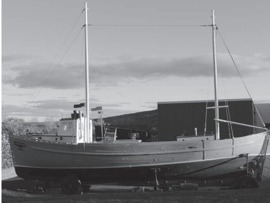
La Gaspésienne n° 20, une fois les travaux de restauration complétés, à l'automne 2016.