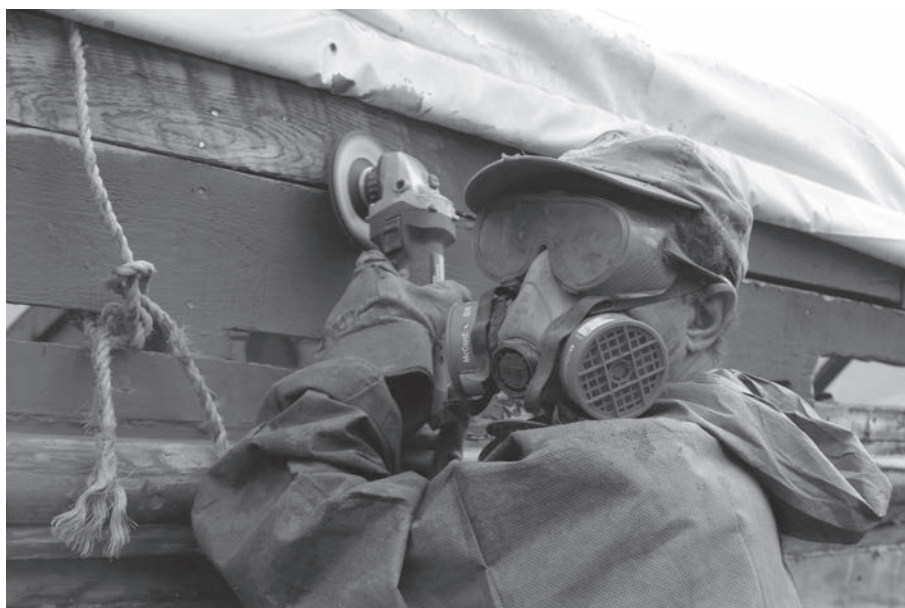
Réal Coulombe, un des membres de l'équipe de 44 bénévoles ayant travaillé à la restauration de la Gaspésienne n° 20, à l'été 2016. .