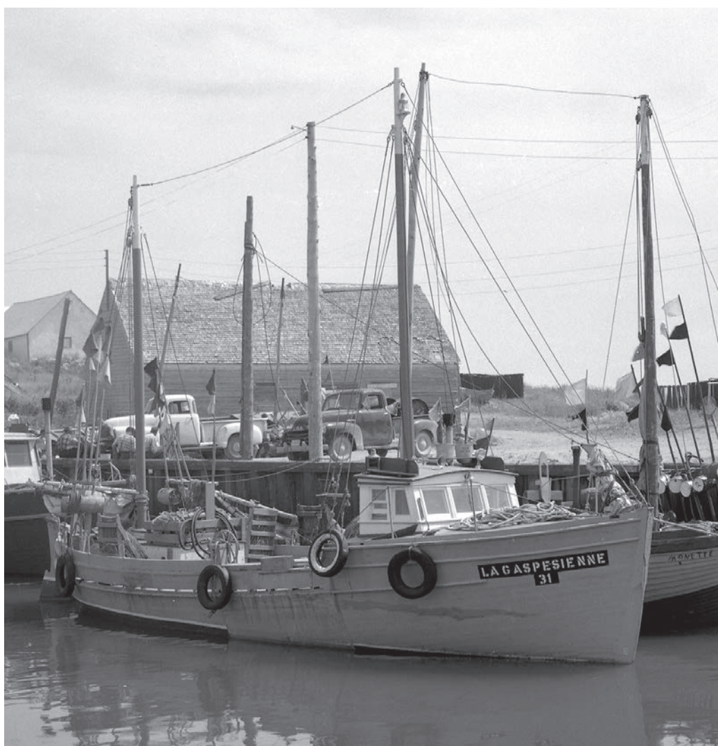
La Gaspésienne no 31. Photo : BAnQ. E6,S7,SS1,P1385-59.

À l'origine, les Gaspésiennes sont des bateaux conçus pour la pêche côtière. Cependant, du côté nord de la péninsule (Rivière-au-Renard, L'Anse-au-Griffon, Grande-Vallée), certains pêcheurs l'utilisent pour la pêche hauturière. Ils se rendent à l'île