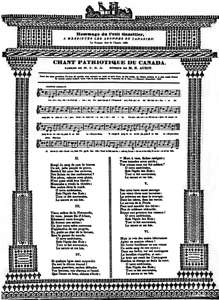
FIGURE 4 – «Étrennes du Canadien», 1836.

Les œuvres de la période, principalement écrites par des jeunes gens, remarquons-le 64 , ne sont pas seulement ambitieuses, elles