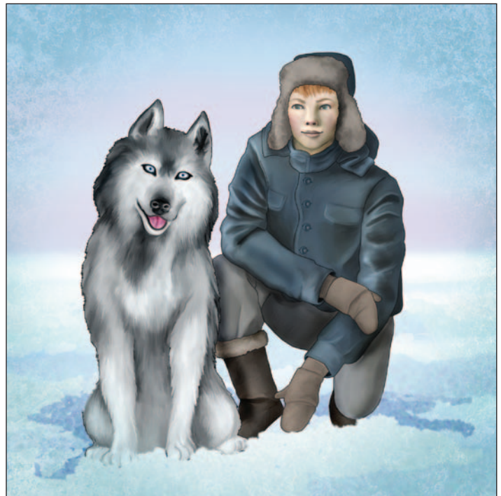
illustration : Laurine Spehner

Grygory, la voix brisée, marqua une pause, alors que ses yeux bleus s'emplissaient d'eau. Il tira sur sa barbe et poursuivit :