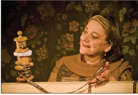
Les habits neufs