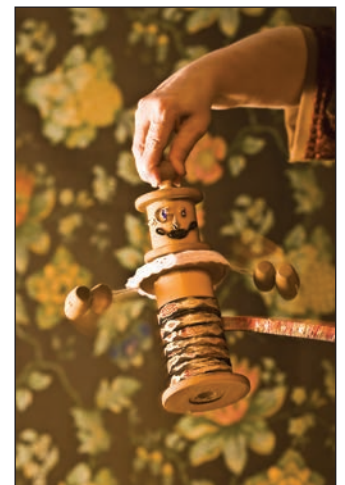
Les habits neufs