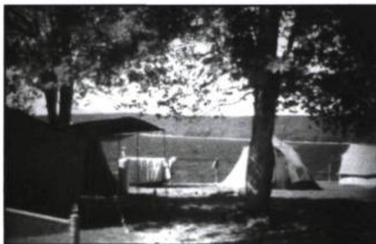
Le camp en plein air, sur le terrain de l'O.T.J. au bord du lac Mégantic.

À sa fondation, le FTEQ se définit comme un festival-camp-clinique. Organisé à la fin du mois d'août, quelques jours avant la rentrée scolaire, ce festival a toutes les allures d'un camp d'été qui allie aux plaisirs d'une compétition et d'une étude du théâtre le plaisir du plein air; il s'inscrit dans le prolongement du mouvement de décentralisation culturelle et de développement du théâtre d'amateurs pour l'évolution du théâtre au Québec. Il regroupe des troupes étudiantes dans un festival compétitif doublé d'une semaine de formation théâtrale intense sous la direction de professeurs qualifiés, et ce à l'intérieur d'un programme