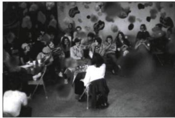
Atelier de dramaturgie avec Michel Tremblay (1970).