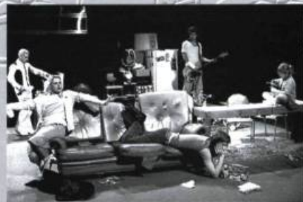
Moeder & Kind (Mère et fille) de la troupe Victoria, la pièce d'ouverture des Coups de Théâtre.

On peut se renseigner au (514) 598-2929.