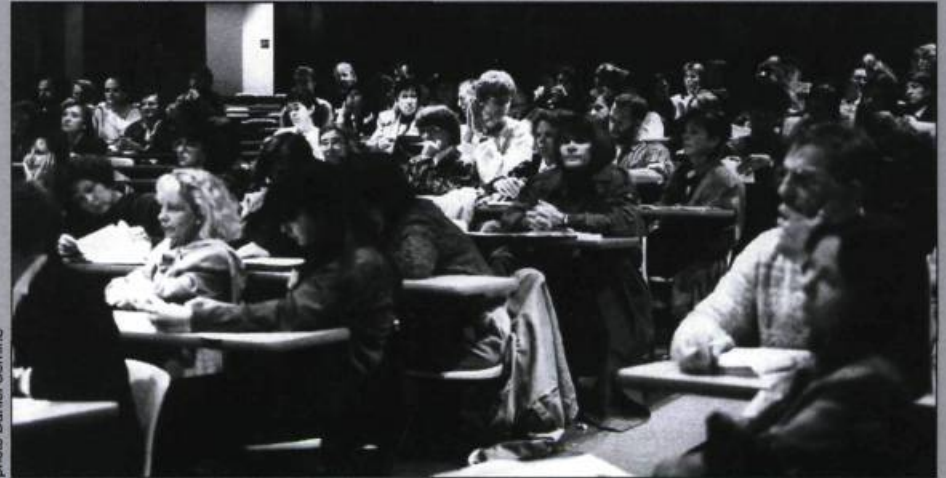
Plus de 150 personnes assistaient à la conférence d'ouverture. Le colloque lui-même a attiré environ 250 personnes.

L'idée de clôturer ainsi le colloque s'est avérée très pertinente, si on en jugeait par l'écoute exceptionnelle du public adulte. Les animatrices, enseignantes, auteures, éditeurs et autres professionnels du livre ont eu la chance d'apprécier la qualité de cette production, qui mérite la plus grande diffusion.