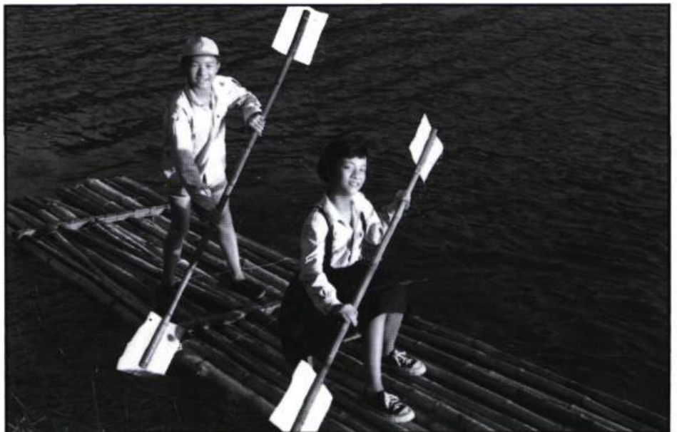
Les enfants de la plantation de thé

Une trousse comprenant les films La double histoire d'Odile et Apprendre ou à laisser ainsi que la revue Zoom sur les enfants sera en vente dans les écoles primaires du Québec dès l'automne 1990. La revue contient des articles sur l'apprentissage et sur l'école.