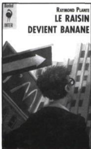
Le titre et l'illustration sont deux excellentes accroches signées Raymond PLANTE et Stéphane POULIN.

Le lecteur se dit : « J'ai lu les trois premiers... Moi aussi, je travaille chez McDonald's... Puis je voudrais bien prendre un appartement... Je l'achète! »