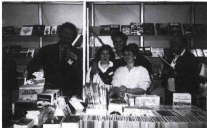
Même s'il change de maison d'édition, l'écrivain de métier conserve SA clientèle.

Pour qu'un livre captive le lecteur, il faut d'abord que le lecteur s'intéresse au livre. Ce dernier, en tant que produit de consommation, doit être acheté ou emprunté par le lecteur lui-même ou par l'intermédiaire d'un adulte. Cela suppose que les professionnels du livre ont tout fait pour que le livre accroche le lecteur et le garde captif. En lisibilité, cette étape primordiale comporte trois volets : l'accroche, le circuit de lecture et le verrouillage. Comme en publicité. N'oublions pas que les jeunes vivent dans un univers de vidéoclip où celui-ci joue un rôle prépondérant.