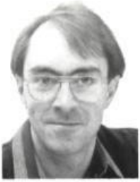
DENIS CÔTÉ auteur