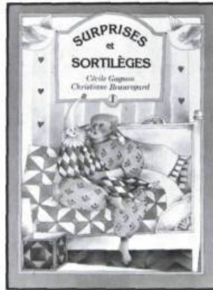
Cécile Gagnon SURPRISES ET SORTILÈGES Illustré par Christiane Beauregard Éditions Pierre Tisseyre, collection Le marchand de sable, 1983, 24 pages. 7,95 $

Guylaine Haman Bibliothèque nationale du Québec