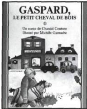
Chantal Couture GASPARD, LE PETIT CHEVAL DE BOIS Illustré par Michèle Gamache Éditions Pierre Tisseyre collection Le marchand de sable, 1983, 23 pages. 7,95 $

Nous voici dans un grenier où Gaspard, un joyeux cheval de bois, traîne depuis de longues années en bonne compagnie... La quiétude du grenier est troublée par la visite de Monsieur Patrimoine, conservateur de musée en quête d'objets rares. Parmi toute la «population» du grenier, Gaspard retient l'attention de l'intrus qui l'entraîne dans un nouveau milieu de vie.