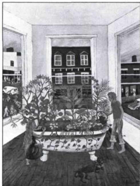
Illustration de Félix Vincent, tirée d'Emilie, la baignoire à pattes (Album) aux Editions Héritage, Montréal, 1978.