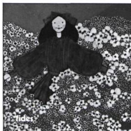
Illustration de Louise Méthé, tirée des Saisons de la mer , Collection du Goéland, aux Editions Fides, Montréal, 1975.