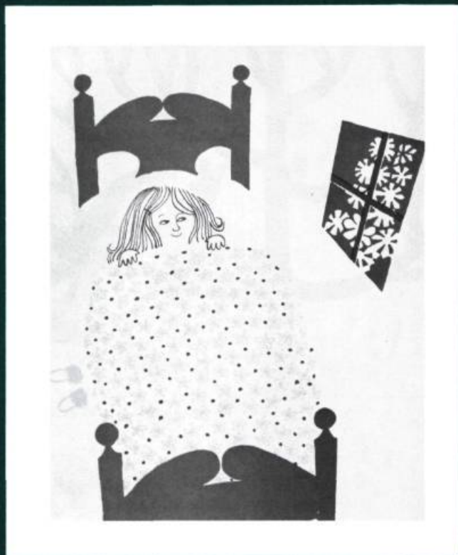
Martine-aux-oiseaux , texte et illustrations de Cécile Gagnon, Québec 1966, Les Editions du Pélican, Illustrations en bichromie.