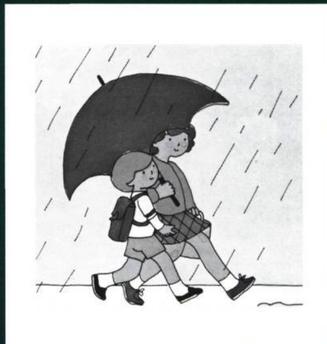
Le parapluie rouge , texte et illustrations de Cécile Gagnon, Montréal 1979, Les Editions Héritage, Illustrations en quatre couleurs et en bichromie.