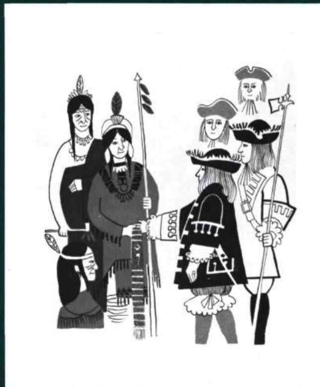
O Canada , texte de Isabel Barclay, Toronto et New York 1964, Doubleday, Illustrations en bichromie.