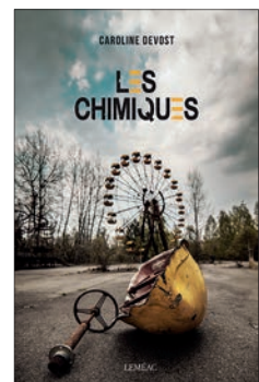
☆☆ Caroline Devost Les chimiques Montréal, Leméac 2019, 192 p., 22,95 $

Les chimiques n'est pas un mauvais livre. L'intrigue est complexe et se penche avec érudition sur plusieurs enjeux cruciaux. Les bonnes idées ne manquent pas. Les fulgurances, par contre, se font rares. Hélène, la protagoniste principale, est incarnée avec beaucoup de maladresse. La langue de Caroline Devost manque de caractère. Un phrasé incendiaire pour un récit nucléaire, voilà ce que nous avons anticipé... ♦