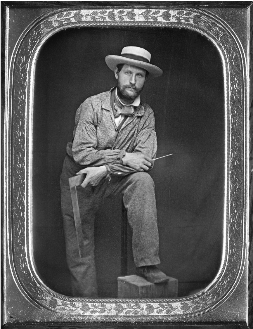
Figure 3 : Charpentier canadien, c1850.