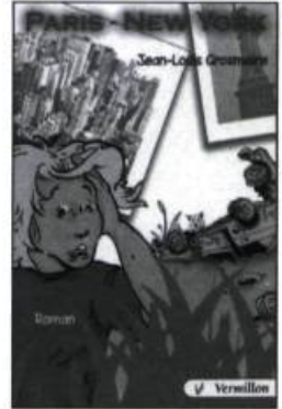
GROSMAIRE, Jean-Louis, Paris-New York , Ottawa, éditions du Vermillon, 2002, 171 p.

Originaire d'Ottawa, Mireille Messier est présidente de l'agence Petit tapis rouge, une compagnie qui se spécialise en rédaction et en production télévisuelle pour les jeunes. Elle est aussi l'auteure du recueil de contes Mirouille raconte... publié au CFORP.