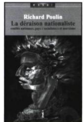
Richard Poulin, La déraison nationaliste , L'Interligne, 2000, 317 p.