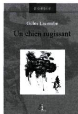
Gilles Lacombe, Un chien rugissant , poésie.