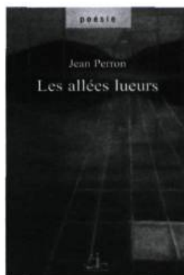
Jean Perron, Les allées lueurs , poésie.