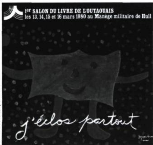
Illustration : Janique Rivest