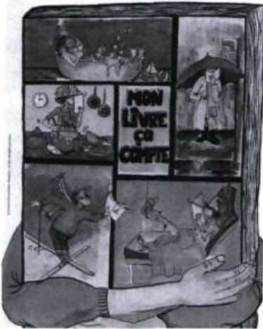
Illustration : Annie Thibault

fête et un élément de foire, afin que les exposants y trouvent leur compte », selon Michel-Rémi Lafond.